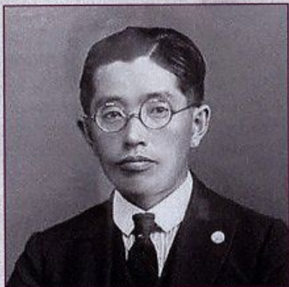
やまもとけんじ 山本宣治 (1889~1929) 京都府宇治市出身の 生物学者。「山宣」と よばれ、親しまれた。