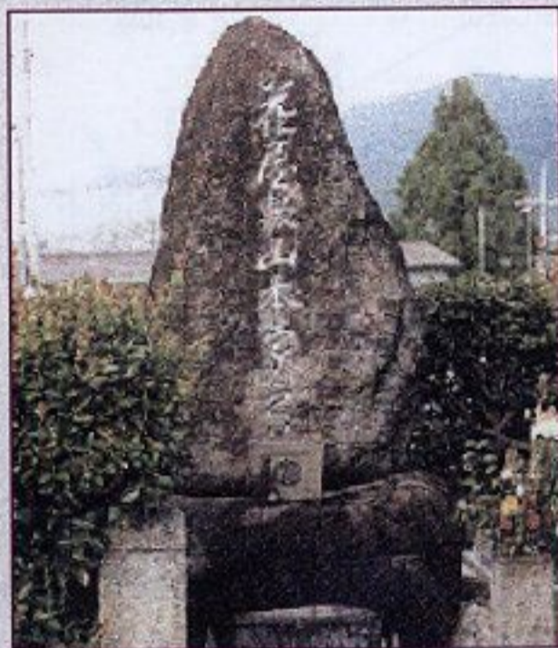
京都府宇治市にある宣治の墓と裏面の碑文